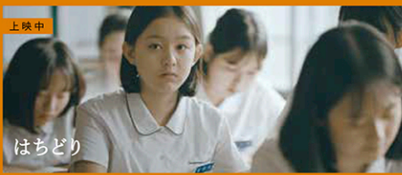
この世界が、気になった——14歳の少女 ウニの物語